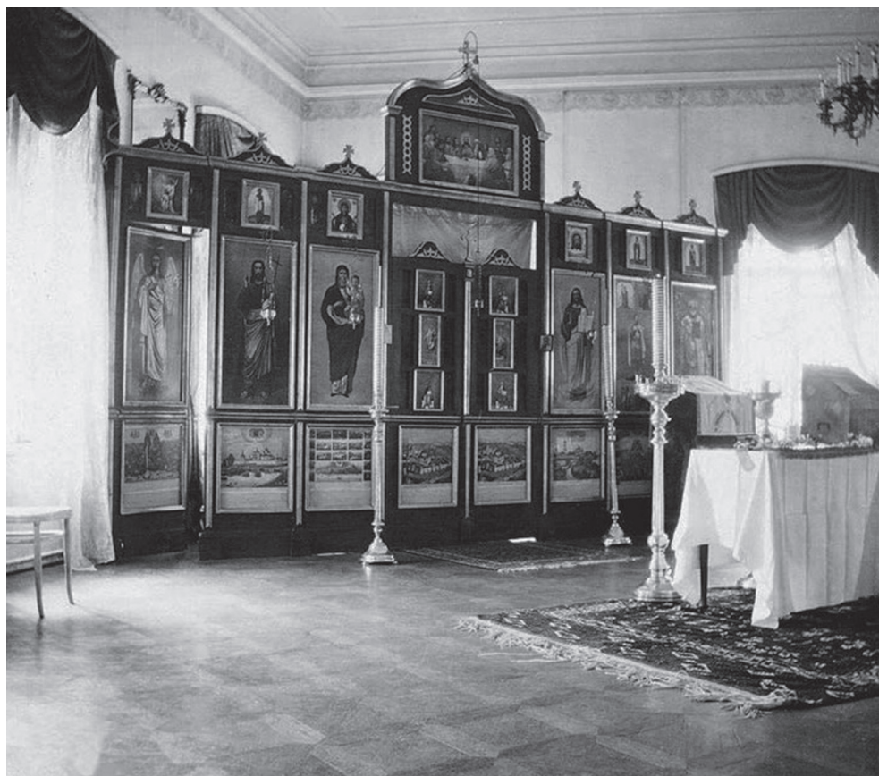
Иконостас, устроенный в губернаторском доме. Завесой Царских врат послужило покрывало Государыни Императрицы. 1918

Аналогично свидетельствует и баронесса Софья Карловна Буксгевден: при походе в церковь «толпа удерживалась солдатами на большом расстоянии. Люди глядели на них в молчании, но иногда можно было увидеть старого крестьянина, ставшего на колени в молитве, или крестьящуюся женщину».