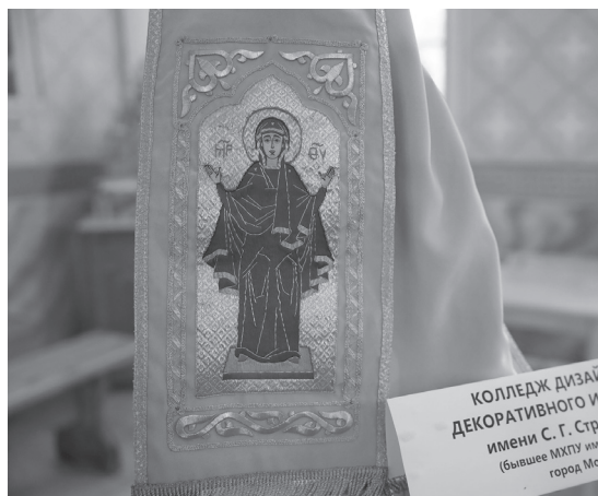
КОЛЛЕДЖ ДИЗАЙН ДЕКОРАТИВНОГО И ИМЕНИ С. Г. Стр (бывшее МХТУ им город Мо