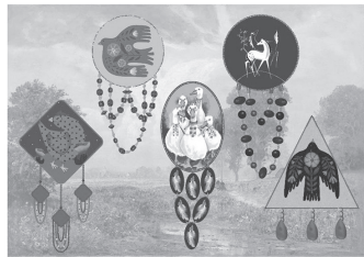
Рис. 2 – Эскизы коллекции наkosников «Времен связующая нить»

В готовой коллекции изделий представлены пять наkosников, выполненных из различных материалов и в различной технике исполнения: роспись по дереву и по ткани (техника «батик»), декорированные бусинами, бисером, лентами, шнуром и сутажем. Простота в изготовлении данных изделий дает возможность выполнить их в домашних условиях, привнося в дизайн свои креативные идеи.