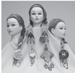
Рис. 3 – Коллекция наkosников «Времен связующая нить»

В готовой коллекции изделий представлены пять наkosников, выполненных из различных материалов и в различной технике исполнения: роспись по дереву и по ткани (техника «батик»), декорированные бусинами, бисером, лентами, шнуром и сутажем. Простота в изготовлении данных изделий дает возможность выполнить их в домашних условиях, привнося в дизайн свои креативные идеи.