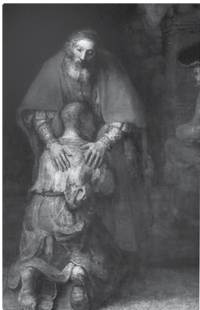
Рембрандт. Возвращение блудного сына.

Холст, масло. 1660-е гг. Эрмитаж. Санкт-Петербург