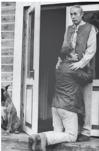
Андрей Тарковский. Финальный эпизод фильма «Солярис» (1972) – цитата полотна Рембрандта

Холст, масло. 1660-е гг. Эрмитаж. Санкт-Петербург